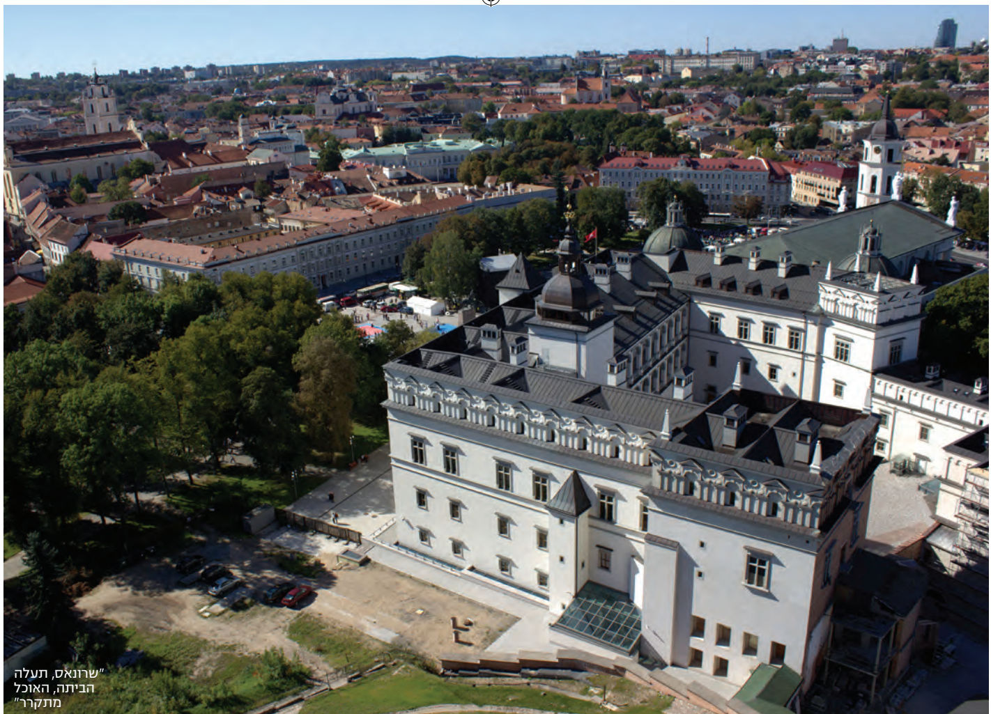
"שרונאס תעלה הביתה, האוכל מתקרר"